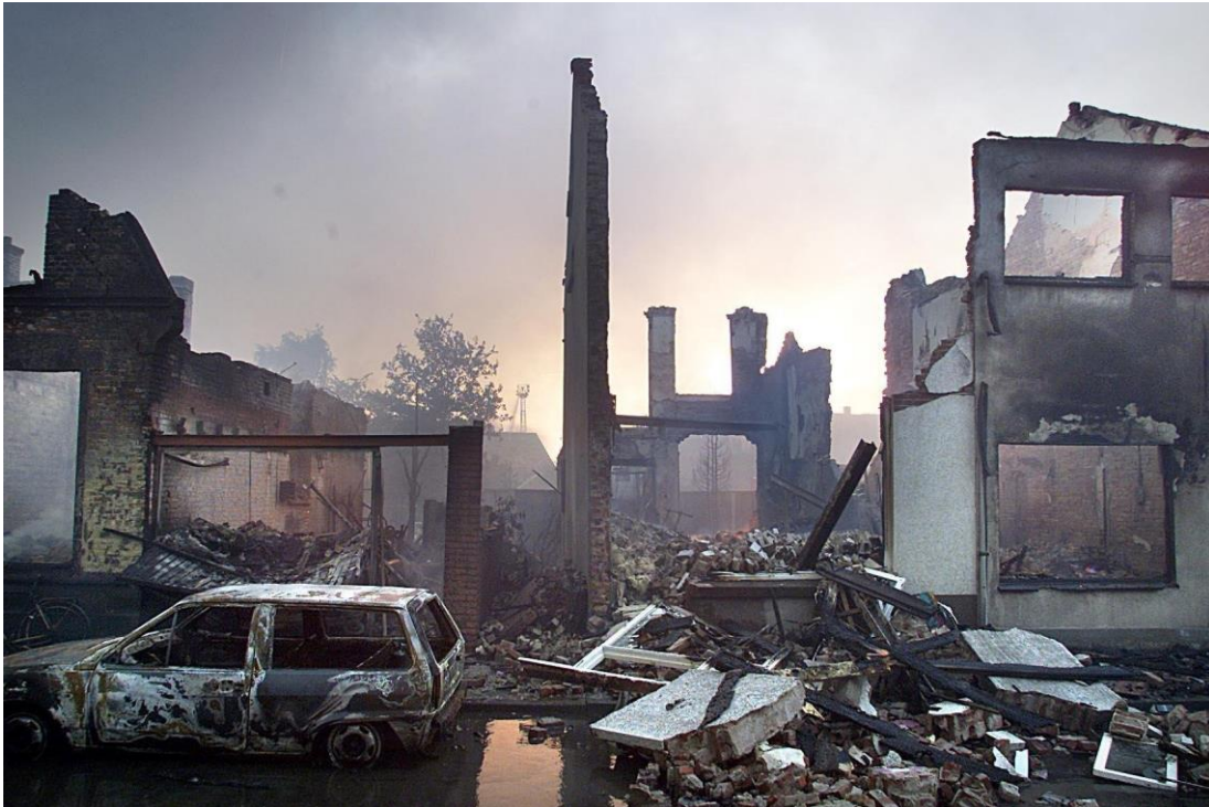
Bild 2, Ruinen in Enschede (NL), Brand einer Feuerwerksfabrik 05-2000

Ein Beispiel: Die Einsatzkräfte in Enschede (Holland) wussten am 13.05.2000 nicht, dass es sich beim Brand in einer Feuerwerksfabrik zunächst um einen Magnesiumbrand handelte - mit verheerenden Folgen, da sie Wasser als Löschmittel einsetzten... Die Katastrophe danach (mit mehreren Sprengexplosionen, ausgelöst durch die verursachte Knallgasexplosion aufgrund des Löschmittels "Wasser") war ein Ereignis, das nur mit einem Bombenangriff auf eine Stadt in einem Kriegsgebiet vergleichbar ist. Das Ergebnis war für Enschede fürchterlich - eine mitentscheidende Ursache der Informationsmangel im erforderlichen Feuerwehreinsatz!