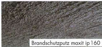
Brandschutzputz maxit ip 160